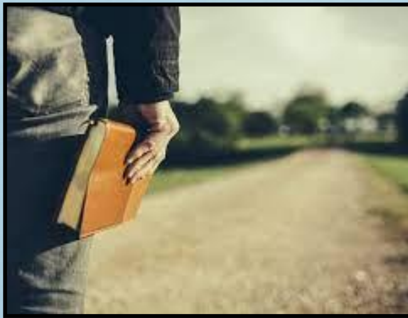
Obediência ao Senhor (v.1b)