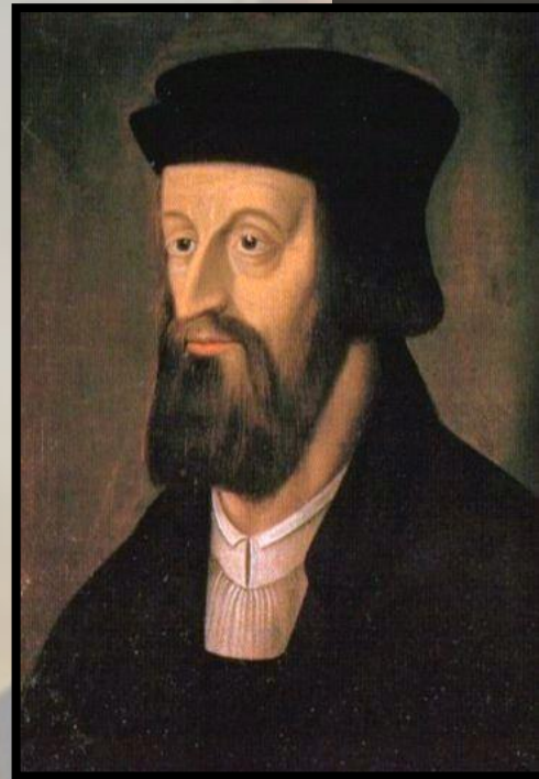
John Huss (Séc. XIV — Igreja Medieval)