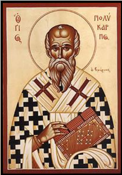
Policarpo de Esmirna (Séc. II — Igreja Antiga)